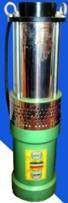
جدول آبدهی الکتروپمپ های کفکش شناور استیل تک فاز و سه فاز دو جداره ۲"