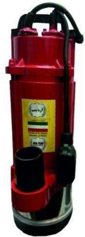
جدول آبدهی پمپ های کفکش ۲